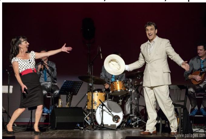
théâtre de l'Atelier 2015